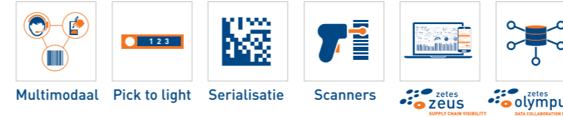
Multimodaal Pick to light Serialisatie Scanners zetes olympus