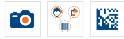
Vision Multimodaal Serialisatie