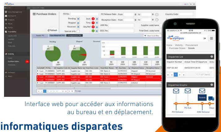
Interface web pour accéder aux informations au bureau et en déplacement.